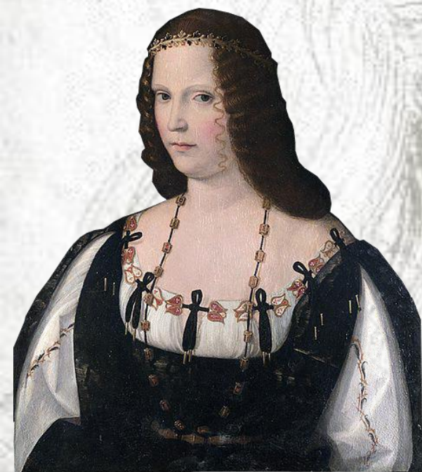
Lucrezia Borgia d'Este

Nel cinquecentenario della morte di due tra i più illustri protagonisti del Rinascimento, Leonardo da Vinci e Lucrezia Borgia d'Este, ripercorreremo assieme le profonde tracce da loro lasciate nelle terre di Romagna, strette attorno ad Imola, nel giro di pochi, significativi anni.